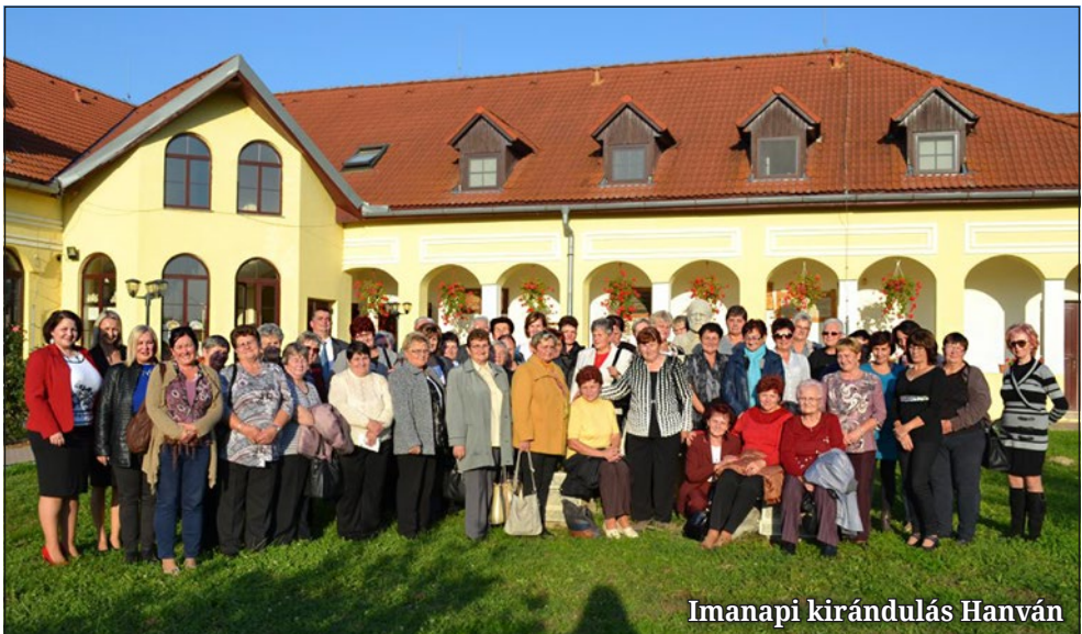
Imanapi kirándulás Hanván